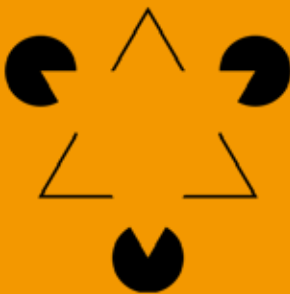
Il triangolo di Kanizsa

Ai partecipanti sarà data in omaggio una stampa botanica tratta dall'erbario Hoertus Eystettensis di B. Besler