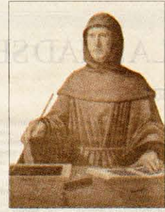
Fra' Luca Bartolomeo Pacioli (Sansepolcro, c. 1445 - Roma, 1517)

Da cinque anni Aboca Museum si interessa agli studi di Leonardo da Vinci per la sua attività di botanico-speciale. La ricerca si è allargata anche ai suoi interessi matematico-prospettivi che gli furono trasmessi da Luca Pacioli. Leonardo disegnò per Pacioli i poliedri del De divina proportione , di cui quest'ultimo aveva appreso i principi da Piero della Francesca, insieme alle regole elementari della prospettiva.