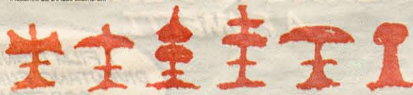
Dopo 500 anni le linee degli scacchi di Pacioli esprimono ancora oggi un forte fascino

assegnato la paternità a Pacioli, che lo scrisse nel periodo di convivenza e d'intensa collaborazione scientifica con Leonardo.