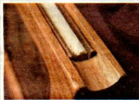
Particolari del facsimile

Aboca Museum ha acquisito il copyright del manoscritto e ne ha pubblicato il facsimile accompagnato da una serie di contributi scientifici, ricchi di aspetti storici, linguistici, paleografici e di tecnica scacchistica, che hanno permesso di caratterizzare l'opera come un esempio di strategie matematiche e logiche del Rinascimento.